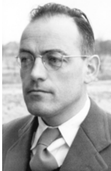
G.P. Baerends

Baerends was bovendien een echte zoöloog, een man die dol was op veldwerk. Regelmatig trok hij er met zijn studenten op uit om dieren in de natuur te observeren. Zo waren er de excursies naar de meeuwenkolonie op Terschelling, waar de groepjes in tenten bivakkeerden voor een onderzoek naar het broedgedrag van de zeevogels. Dan werd er onder meer gekeken wanneer broedende meeuwen op eieren gelijkende houten voorwerpen accep-